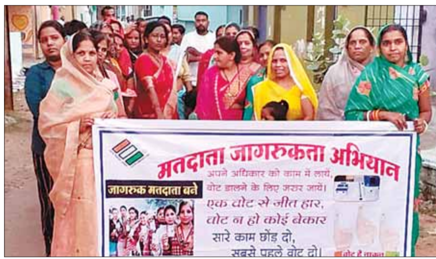
बुधवार। जागरूकता रैली नगर में निकाली गई जिसमें आंगनवाड़ी कार्यकर्ता एवं स्वास्थ्य विभाग के कर्मचारियों ने हाथों में दवाित लेकर मतदान से संबंधित सलोगन सारे काम छोड़ दो सबसे वोट दो के नारे लगाते हुए नगर परिषद के नेतृत्व में मतदाता

आंगनवाड़ी कार्यकर्ताओं, सफाई कामगारों ने नगर में निकाली मतदाता जागरूकता रैली