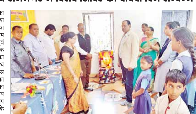
प्राध्यापक शासकीय महाविद्यालय कोतमा से आये जिन्होंने अपने व्याख्यान में राष्ट्रीय सेवा योजना क्या है, जिसको अधिक आसान शब्दों के माध्यम से शिविरियों को बताया। इससे उपस्थित सभी शिविरियों बहुत लाभान्वित हुए। नागरिकों